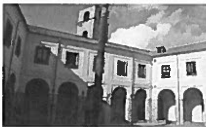
L'IC Ettore Sacconi di Tarquinia

Nell'ambito dei progetti europei Erasmus Plus, l'IC "Ettore Sacconi" di Tarquinia ha avviato nella cittadina di Paikuse in Estonia, il progetto CONTEST, che mira a migliorare l'attività educativa