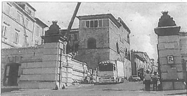
Mostra importante Al Museo di Tarquinia

anni trenta del XX secolo, è formata da 80 tavole con i dipinti delle tombe, realizzate su cartoncini ruvidi, con tecnica mista a china, acquerello, tempera e pastello e di 31 disegni, eseguiti su cartoncini lisci, che riportano planimetrie e sezioni degli ipogei.