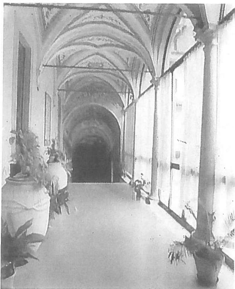
SANTA ROSA L'interno del convento che ospita le clarisse