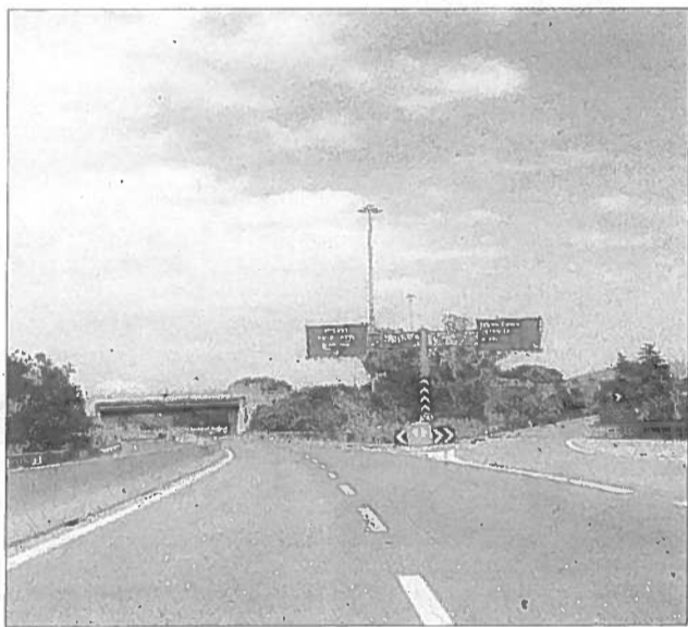
L'eterna incompiuta La Trasversale Orte-Civitavecchia