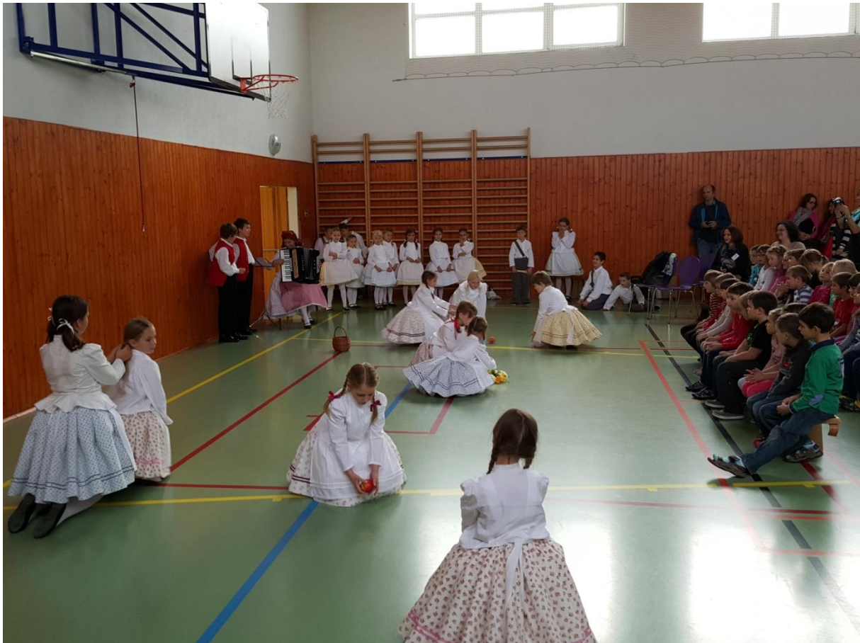
Lo spettacolo di benvenuto degli alunni di Sivice