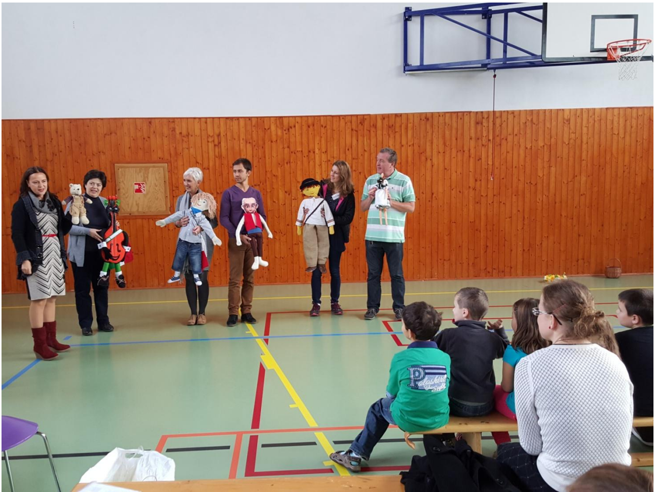
La presentazione delle mascotte nella scuola di Sivice