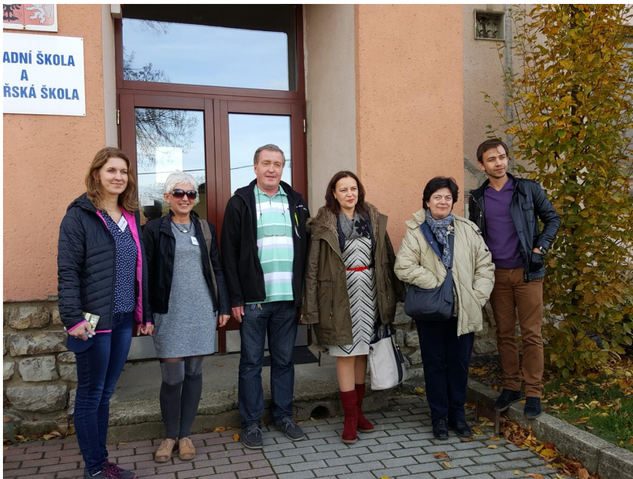
Tutti i Coordinatori del progetto LIVELY ENGLISH BOOK FOR CHILDREN a Sivice (Rep. Ceca)