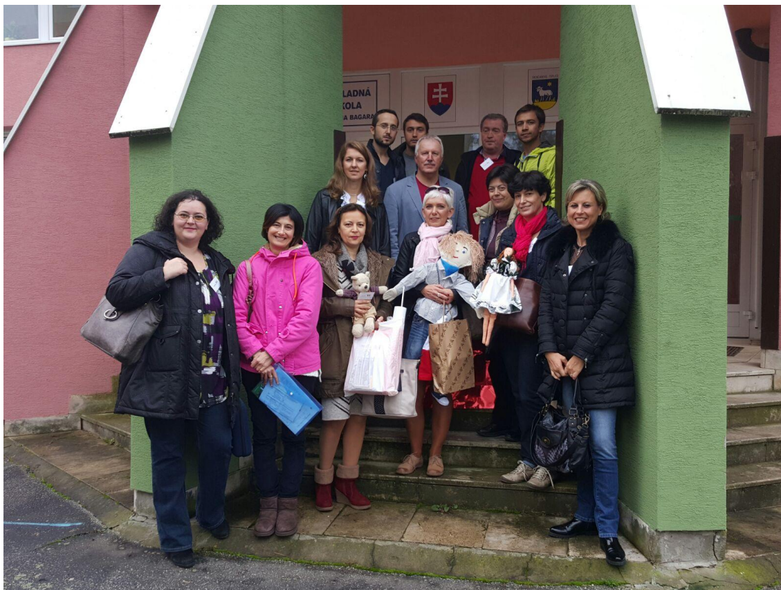
Tutti i partecipanti all'incontro transnazionale di progettazione provenienti da: Slovacchia (paese ideatore e coordinatore); Repubblica Ceca; Polonia; Romania; Turchia e Italia riuniti a Trencianske Teplice (Slovacchia).