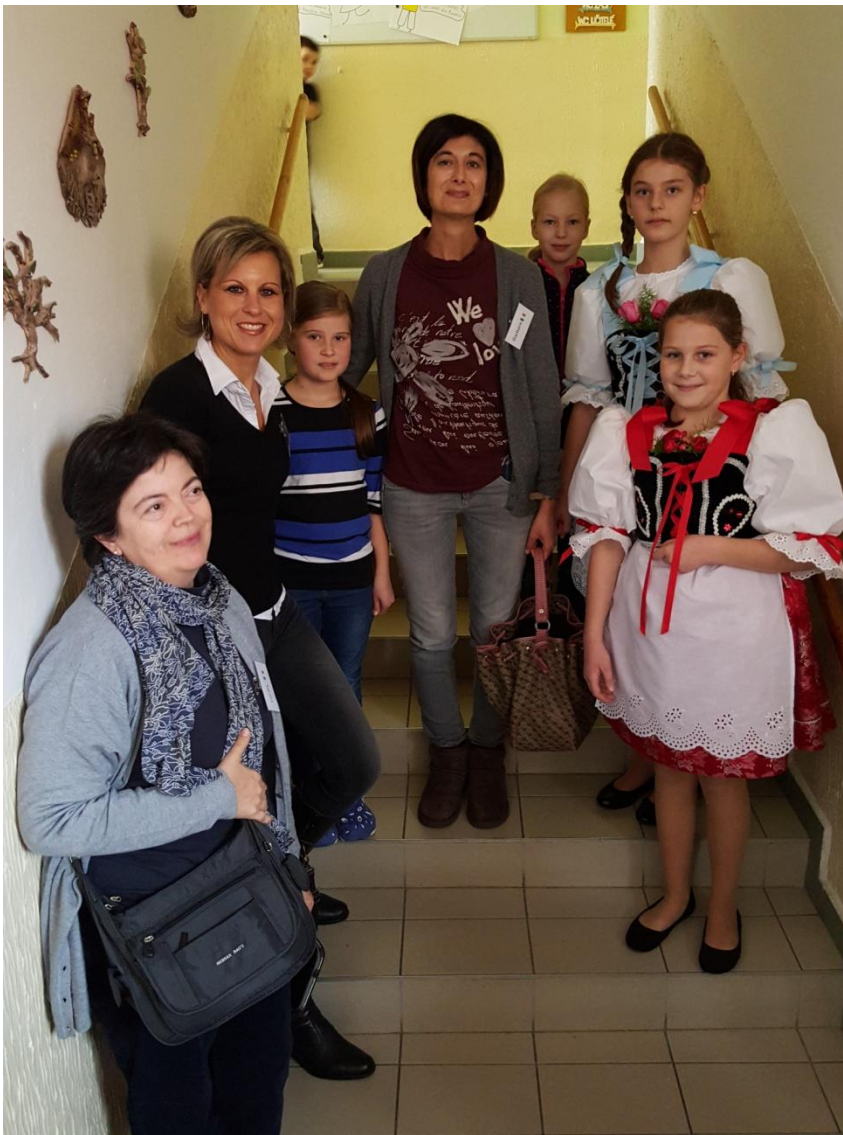
Alunne in costume nazionale (Sivice).